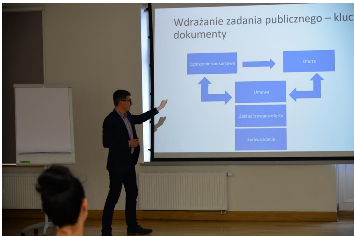
Fot. Szkolenie o zlecaniu zadań publicznych