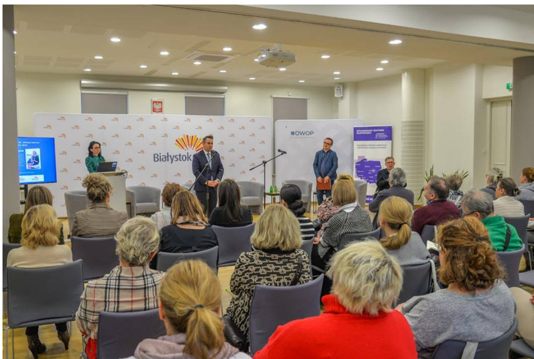
Fot.: Uczestnicy Forum Inicjatyw Społecznych Miasta Białystok 2023

W strukturze organizacyjnej Centrum Aktywności Społecznej działa pełnomocniczka Prezydenta Miasta Białegostoku ds. współpracy z organizacjami pozarządowymi oraz Centrum Współpracy Organizacji Pozarządowych jako ośrodek wsparcia białostockich organizacji pozarządowych. Realizują oni działania o charakterze edukacyjnym i informacyjnym: szkolenia, spotkania robocze, indywidualne konsultacje dotyczące zarządzania organizacją pozarządową i współpracy z samorządem miejskim, pozyskiwania środków finansowych na działalność trzeciego sektora z różnych źródeł, partycypacji społecznej i rozwoju wolontariatu. W 2023 r. pełnomocniczka udzieliła 126 indywidualnych konsultacji.