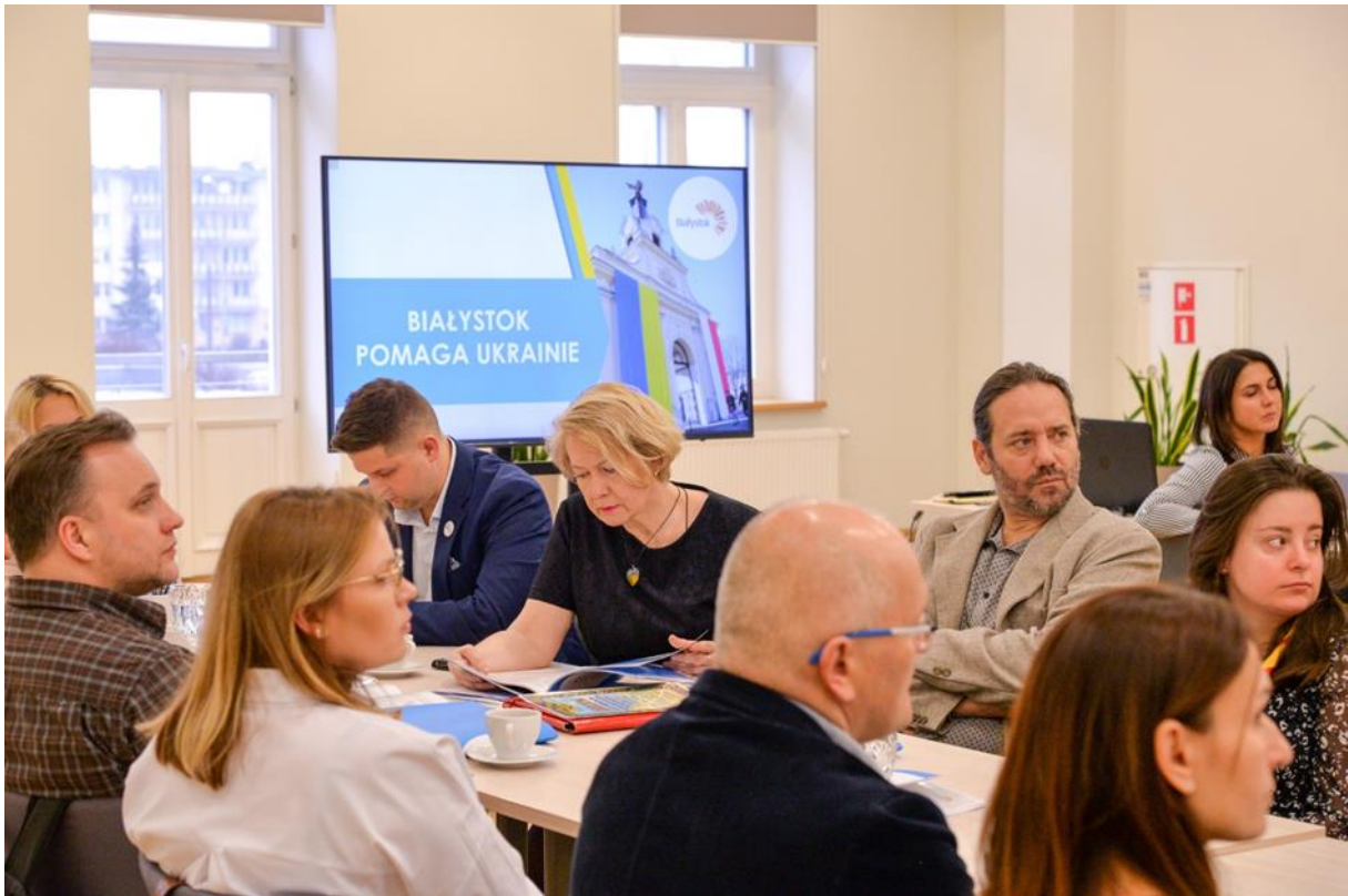
Fot. Spotkanie dotyczące podsumowania rocznego wsparcia uchodźców z Ukrainy