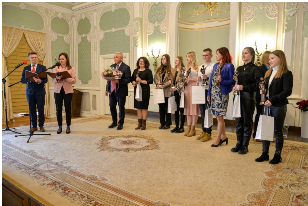
Fot.: Gala Samorządowego Konkursu Nastolatków „Ośmiu Wspaniałych” w Białymstoku

W 2023 r. Miasto zorganizowało 27 białostocką edycję ogólnopolskiego Samorządowego Konkursu Nastolatków „8 Wspaniałych”. Ideą Konkursu jest podkreślenie znaczenia społecznego zaangażowania młodzieży na rzecz mieszkańców Białegostoku. W Konkursie uczestniczyło 58 indywidualnych wolontariuszy i 11 grup. Wyróżniono 8 osób w kategorii wiekowej 10-12 lat „Ósemeczki” i 8 osób w kategorii wiekowej 13-20 lat „Ósemki” oraz 1 zespół w kategorii „Grupa” poprzez nadanie honorowego tytułu: „Wspaniała Wolontariuszka” i „Wspaniały Wolontariusz”.